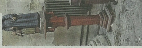
La chapelle se trouve à l'angle des rues Prévost et de l'Ancien Temple. Le pilier central (à droite sur la photo ci-dessous) s'est enfoncé dans le sol, déséquilibrant le bâti.